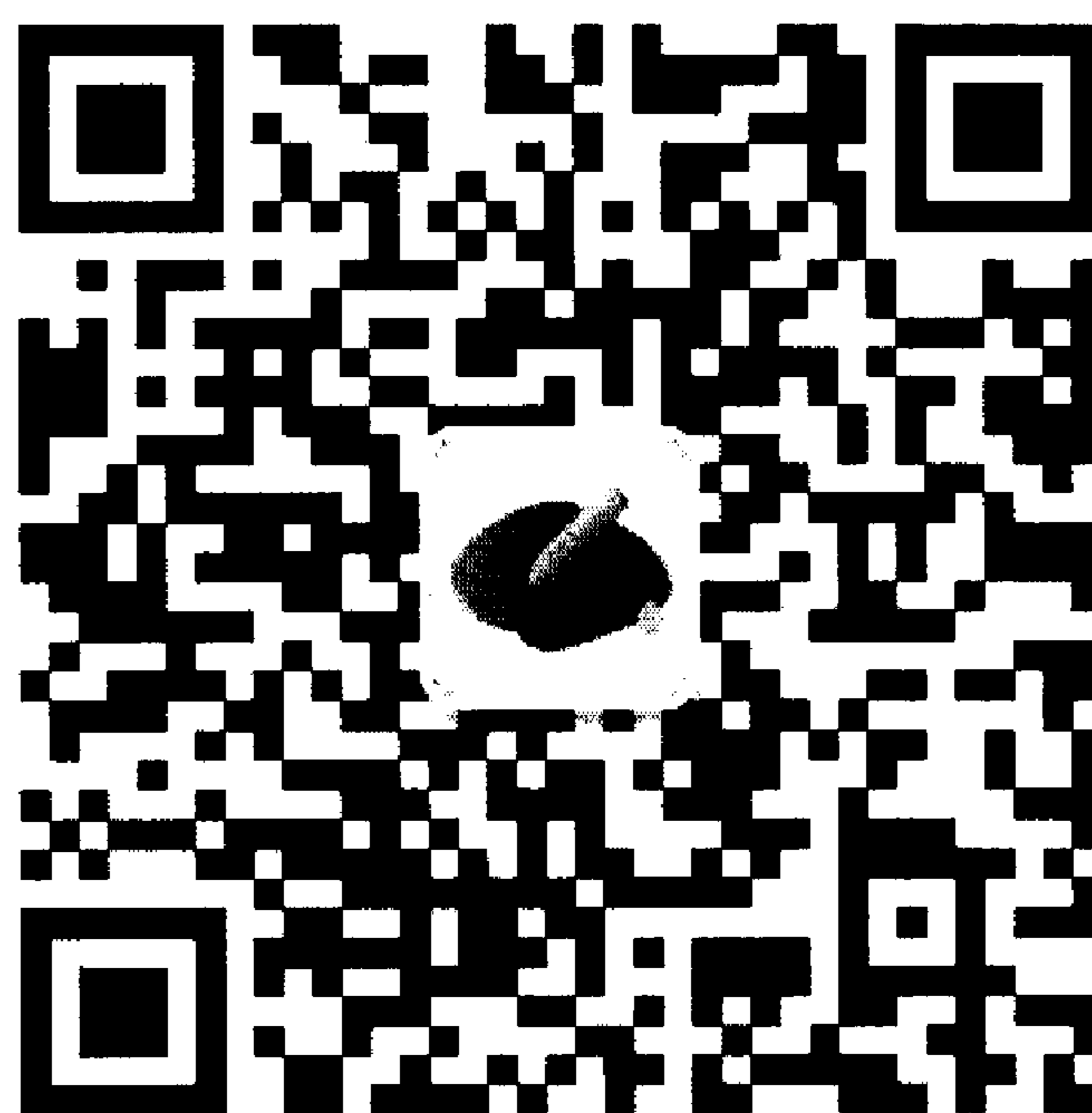
（畅享社区积分入学咨询平台二维码）